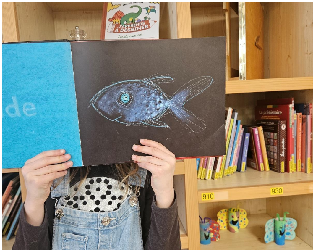
L'animal totem d'Elyne est un poisson bleu (comme Dory) car elle aime aider tout le monde.